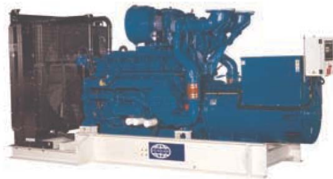
Рисунок приведен исключительно с иллюстративной целью